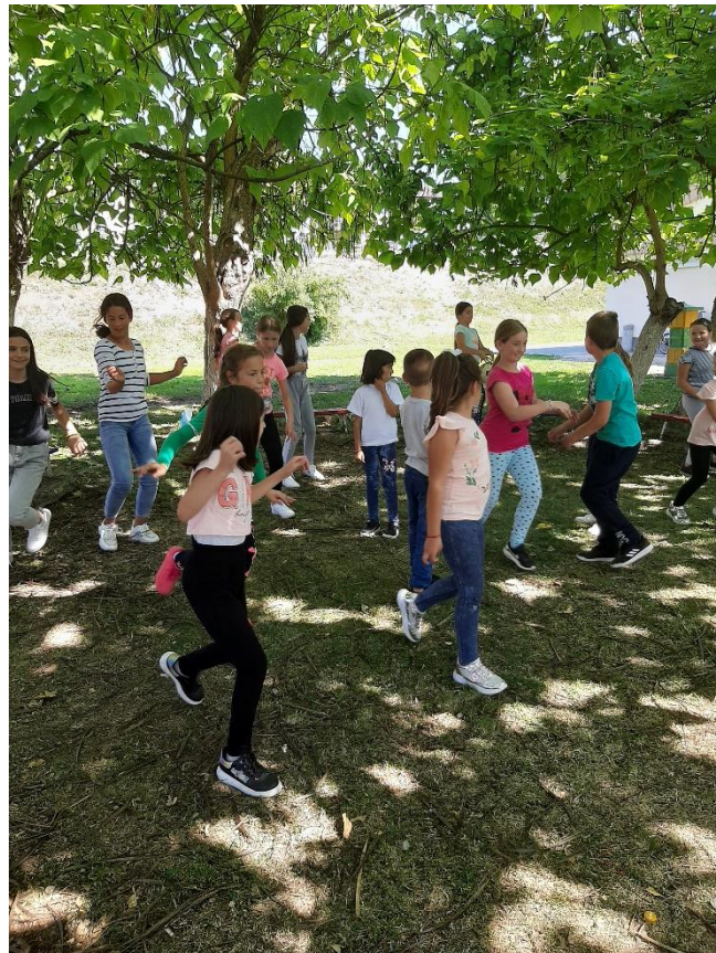
Уводна игра и рекреација

Реализација пројекта почела је у среду, 15. септембра. Циљ нам је био да првог дана постигнемо договор са ученицима па смо се окупили у школском дворишту. Ученици су најпре имали спортске активности на школском терену. Такмичили су се у различитим активностима, спортским играма и уједно искористили време за боравак напољу. Након тога отишли су на ручак а потом се приступало изради домаћих задатака односно реализацији модела Подршка у учењу.