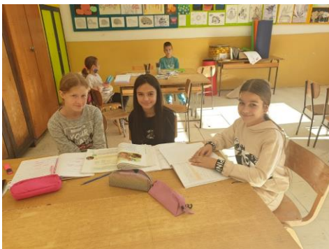
Лепа и радна атмосфера помаже да се градиво лакше и продуктивније усвоји

И ученици старијих разреда такође присуствују реализацији овог модела. Ученици су старији па самим тим и самосталнији у изради својих задатака а вршњачка сарадња им је од велике користи у савладавању градива.