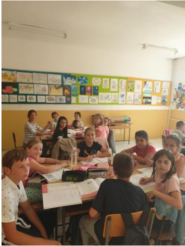
Ученици читају текстове, одговарају на питања, размењују мишљења