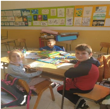
Ученици решавају ребусе, лавиринте, осмосмерке

И ученици старијих разреда такође присуствују реализацији овог модела. Ученици су старији па самим тим и самосталнији у изради својих задатака а вршњачка сарадња им је од велике користи у савладавању градива.