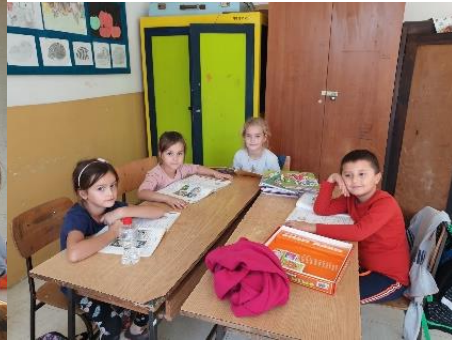
Ученици у оквиру разреда решавају домаће задатке, ту су и занимљиве дечије игрице