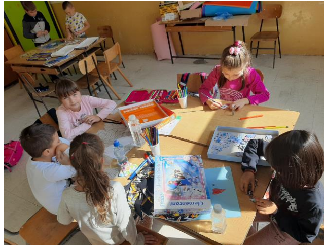
за одмор након завршених школских обавеза