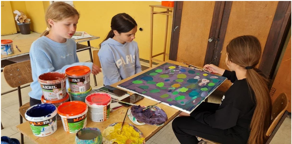
Ученици сликају по репродукцији слике Клод Монеа „ Локвањи“.