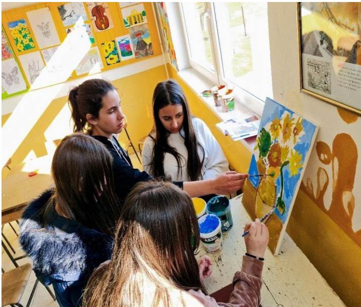
У рад је укључено више ученика