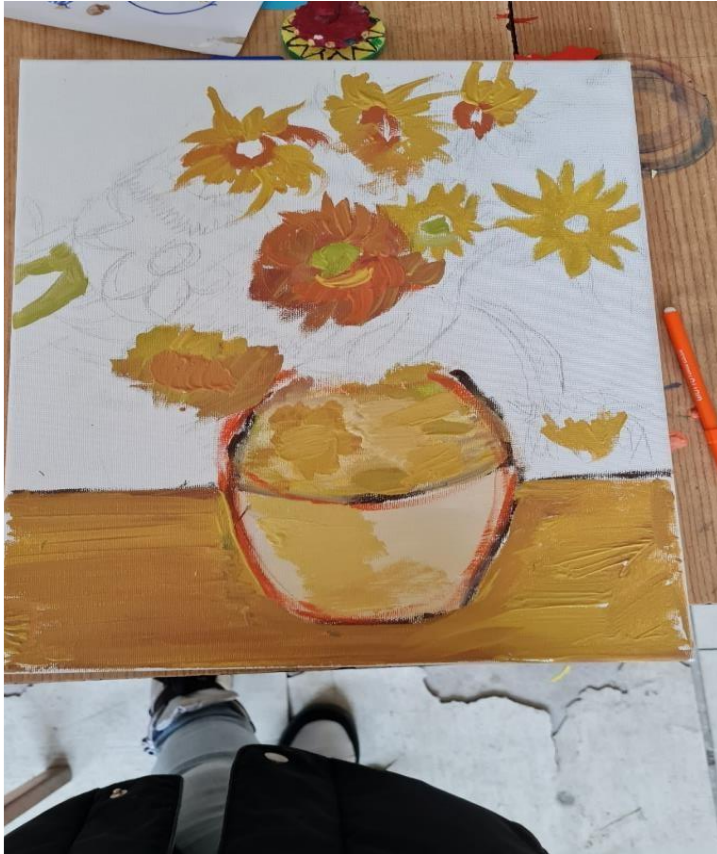
Поставка и подсликавање.