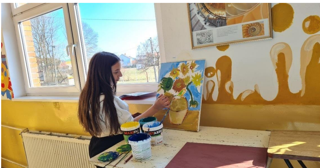
Ученица ради по репродукцији Ван Гога, слика „ Сунцокрети“.