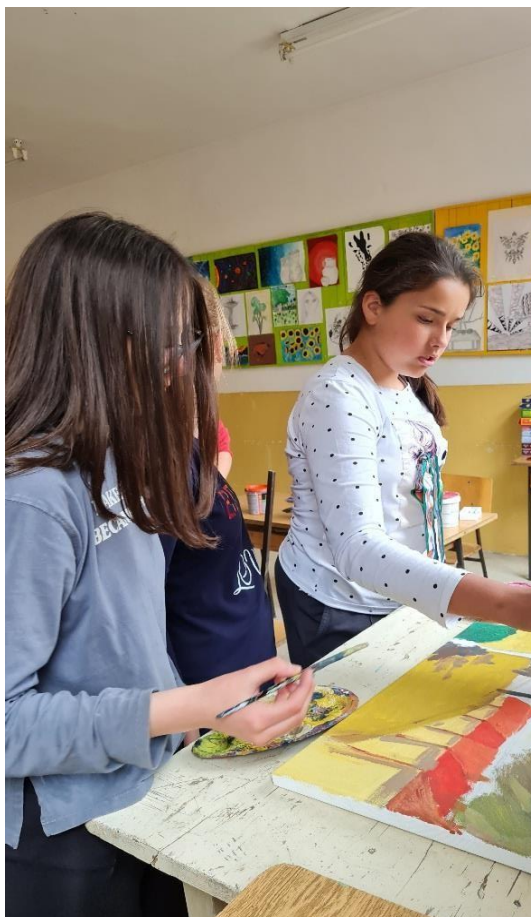
Слика по репродукцији Малише Глишић „Борови“